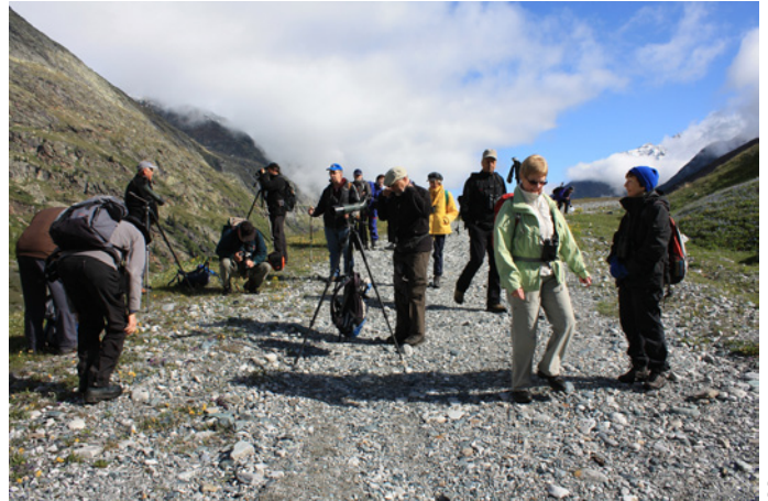
Steinböcke liessen sich regelmässig blicken