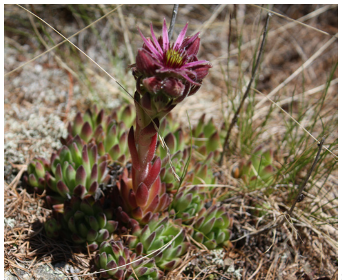
Auch die Botanik kommt nicht zu kurz