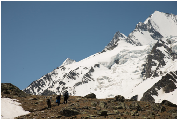
Aufstieg auf den Mällig