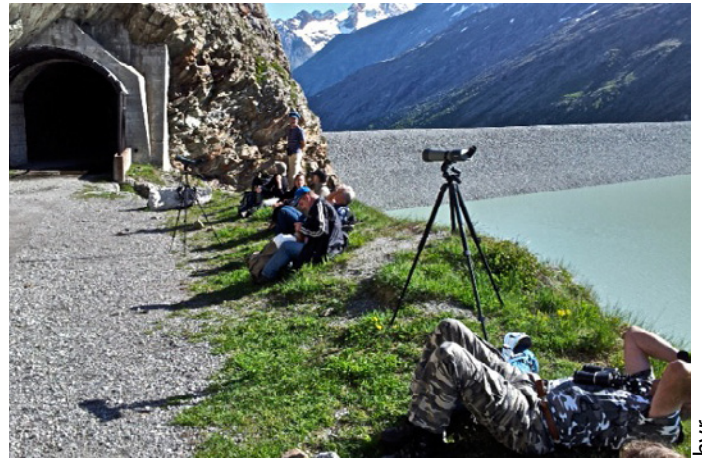
Warten auf den Mauerläufer