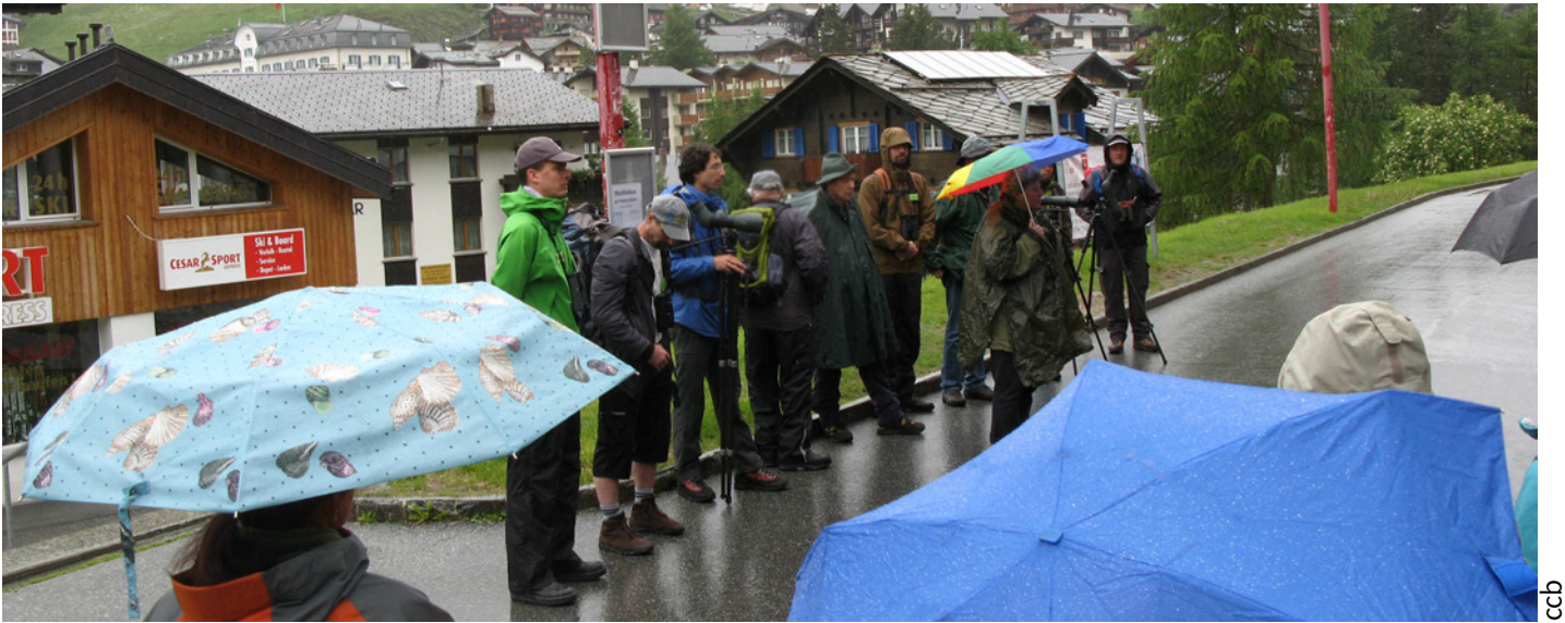
Die ersten Exkursionen fanden noch bei Regen statt, doch das Wetter besserte sich bald.