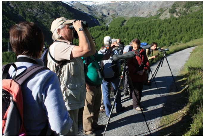
Unterwegs oberhalb Saas Fee