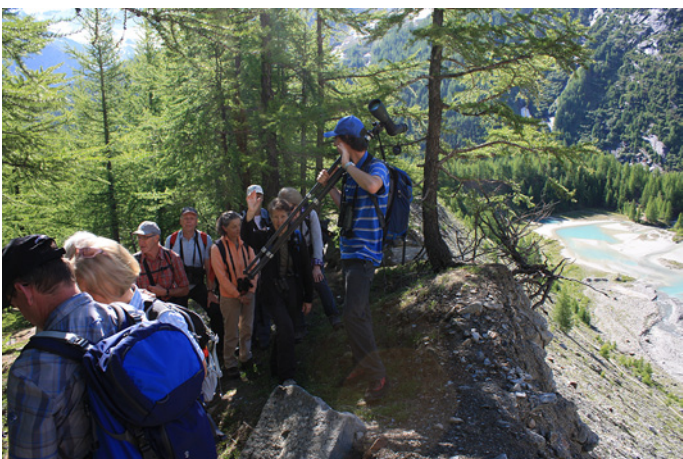
Oberhalb des Gleschensees